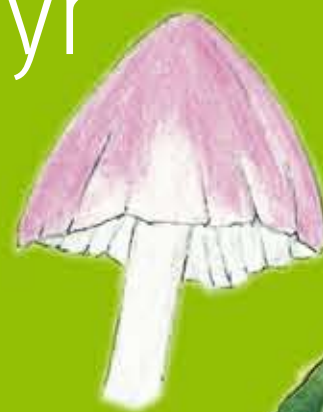
Cap Cwye Punc Pink Waxcap - Hygrocybe calyptriformis