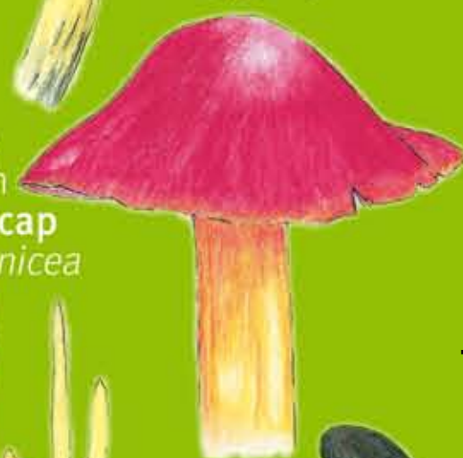
Cap Cwye Rhuddgoch Crimson Waxcap - Hygrocybe punicea