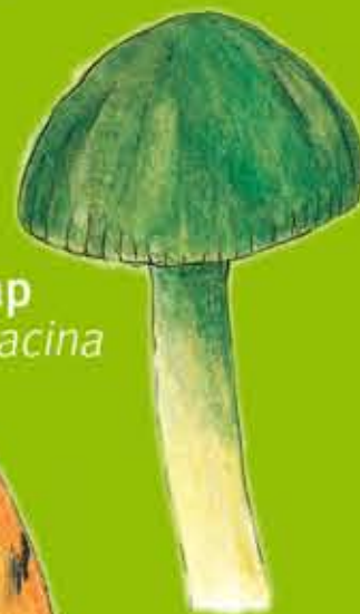
Cap Cwyr Amryliw Parrot Waxcap - Hygrocybe psittacina