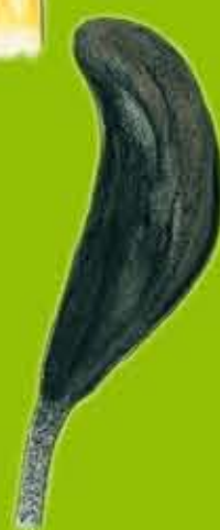
Tafodau'r Ddaear Earthtongue - Geoglossaceae

Gwarchodfa Natur Genedlaethol Waun Las National Nature Reserve Gardd Fotaneg Genedlaethol Cymru