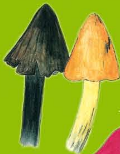
Cap Cwye Dud Blackening Waxcap - Hygrocybe conica